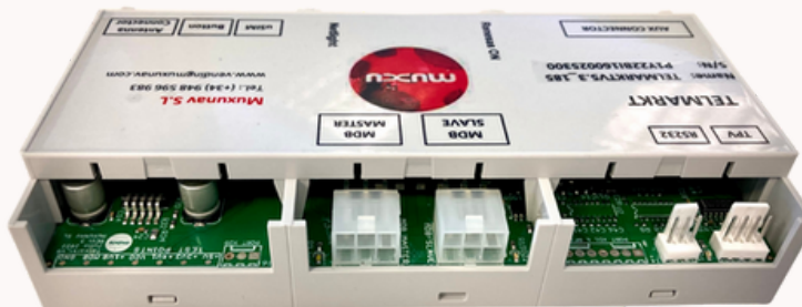
Vista trasera. Conexiones MDB